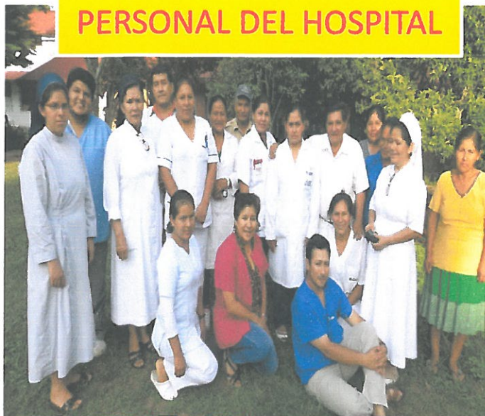
PERSONAL DEL HOSPITAL