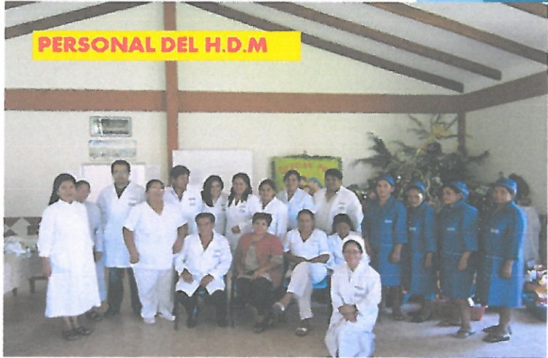
PERSONAL DEL H.D.M