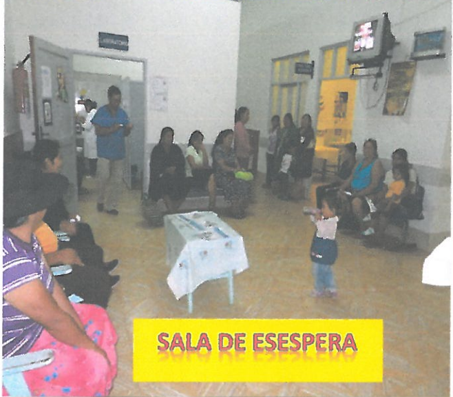
SALA DE ESESPERA